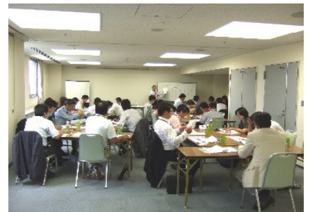
実践的ですぐに使える様式集が良いと、 沢山の方から評価をいただいています。